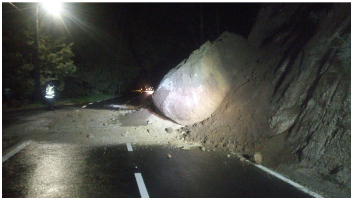
Imagem 2 – Movimento de vertente de massas