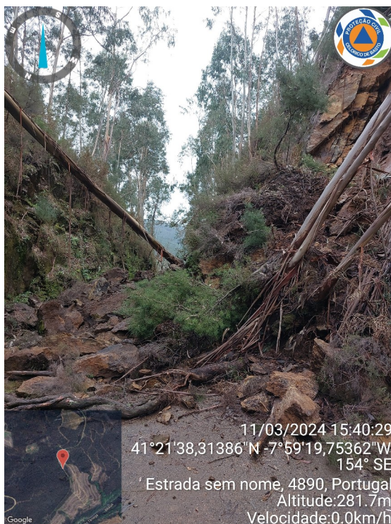
Figura 1 –Antes

Solicita-se a todos os utilizadores, principalmente os que utilizam meios de locomoção com rodas de raio reduzido ou de espessura reduzida (ex: patins, bicicletas de estrada, etc.), especial atenção no local da derrocada, pois o pavimento encontra-se em terra batida devido aos estragos da derrocada. O local está sinalizado com sinalética de trânsito.